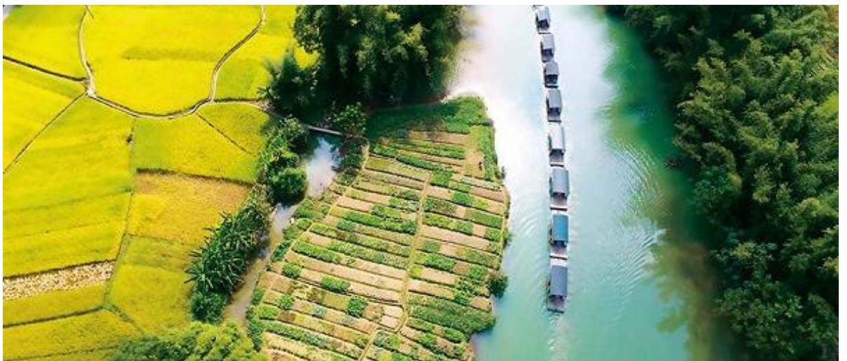
Bamboo rafts line up on the river in the Mingshi tourist resort.

รถบัสนำท่านไปส่งที่ท่าแพต้นน้ำ เพื่อให้ท่าน ลงแพไม้ไผ่หมิงชื่อเถียนเหยียน ชมทัศนียภาพสองฝั่งลำน้ำ และบรรยากาศอันสดชื่นที่มีภูเขาที่เป็นฉากหลัง ที่เรียกว่า "วิวภาพเขียนร้อยสี" วิวนี้โด่งดังเพราะ มีซีรีส์ทีวี "ฮวาเซียนกุ" มาถ่ายทำที่นี่ ขณะลงแพท่านจะได้พบเห็นวิถีชีวิตของชาวฉางชนบท ที่ออกมาทำกิจกรรมประจำวัน เมืองฉิงซีมีอากาศเย็นสบายและมีทัศนียภาพทางธรรมชาติสวยงามคล้ายเมืองกุ้ยหลิน