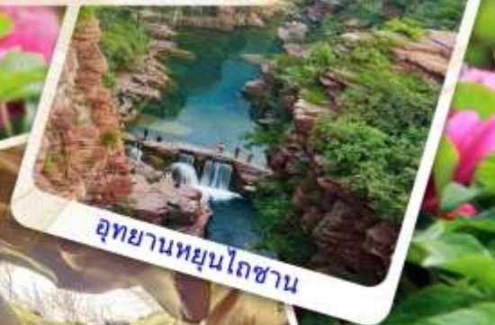
อุทยานหยุนโถซาน