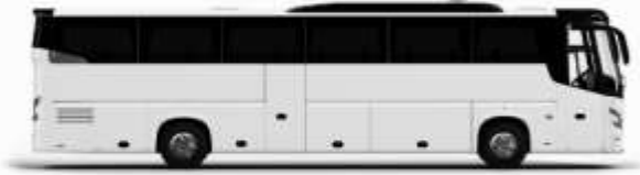
ตัวอย่างรูปภาพ 1 คัน

ค่าที่พักตามที่ระบุในรายการหรือเทียบเท่าระดับเดียวกัน (พักห้องละ 2 ท่าน) หากประเภทห้องที่ท่านริเสวนาเต็มออก เช่น ริเสวนาห้องพักเป็น TWIN BED หรือ DOUBLE BED ทางบริษัทขอสงวนสิทธิ์ในการปรับประเภทห้องพัก เป็นตามที่โรงแรมมีอยู่ โดยไม่ต้องแจ้งให้ทราบล่วงหน้า