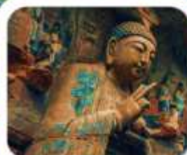
"มรดกโลกผาหินแกะสลักต้าจู้"