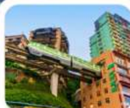
"นั่งรถไฟทะเลสาบ"