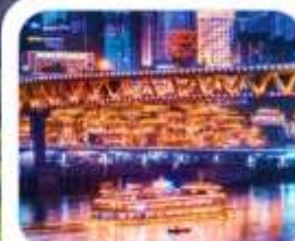
"ล่องเรือชมฉงชิ่ง"