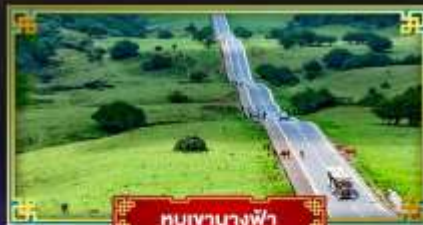
ขุนเขาทางฟ้า