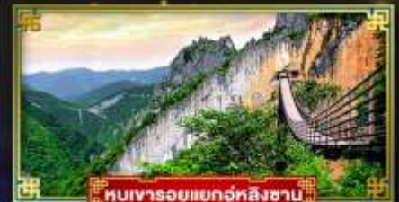
หุบเขารอยแยกอุทงซิงซาบ