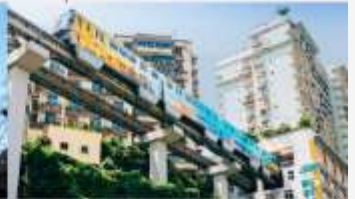
รถไฟฟ้าทะเลตุ๊ก

*ทางบริษัทฯ ขอสงวนสิทธิ์ในการสลับโปรแกรมทัวร์ตามความเหมาะสมขึ้นอยู่กับสถานการณ์ปัจจุบัน โดยคำนึงถึงผลประโยชน์ของลูกค้าเป็นหลัก