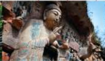
ผาคินแกะสลักต้าจู้ เขาเป่าตึงซาน