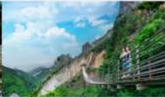
หุบเขารอยแยกอุ๋หลิงซาน