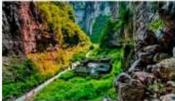
อุทยานแห่งชาติหลุมฟ้า 3 สะพานสวรรค์