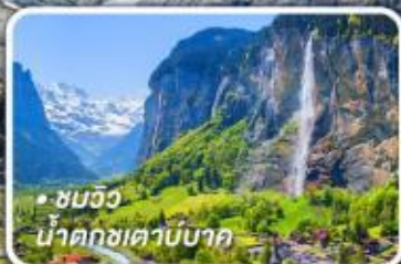
• ชมวิว น้ำตกเซตาบาค

กับรถไฟด่วนขบวนสวรรค์ เซอร์แมท-อันเดอร์แมท