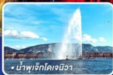
• น้ำพุเจ็ทโคเจนิวา

นั่งรถไฟด่วนกราชียเอ็กซ์เพรสระดับเฟิร์สคลาส