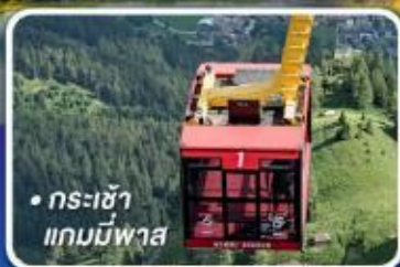
• กระเช้า แกมมีพาส