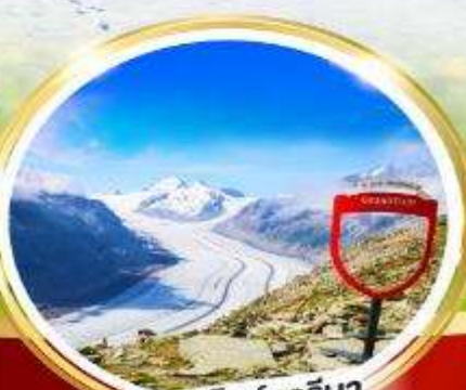
อาเล็กซารีนา