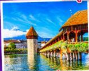
ลูซิิร์น