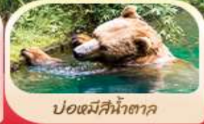
ปอแตมีสีน้ำตาด