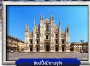
ช็อบบิงมีลาเนาจูโจ