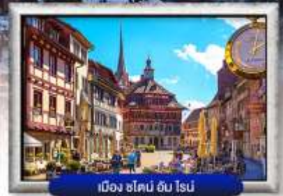
เมือง ซ็อบบ์ อัม ไรน์