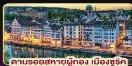
ตามรอยสหายผู้ทอง เมืองซูริค