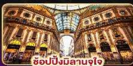
ช้อปปิ้งมิลานจุใจ