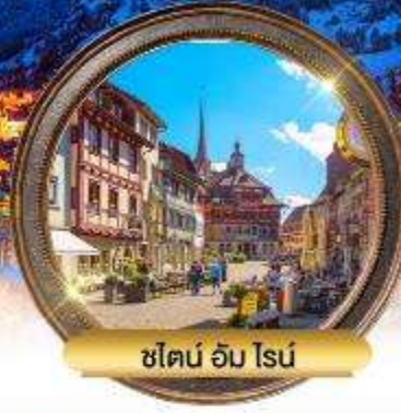
ชไตน์ อัม ไรน์