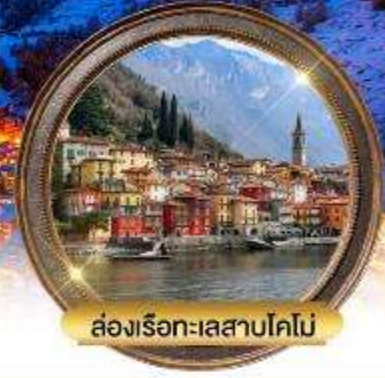
ล่องเรือทะเลสาบโคโม