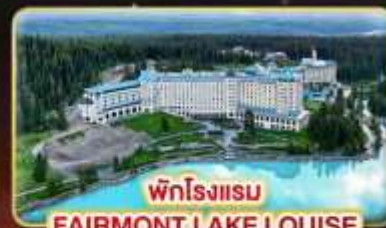
พักโรงแรม FAIRMONT LAKE LOUISE