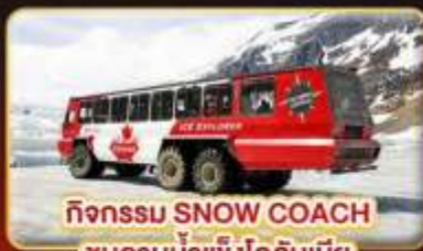
กิจกรรม SNOW COACH ชมลานน้ำแข็งโคลัมเบีย