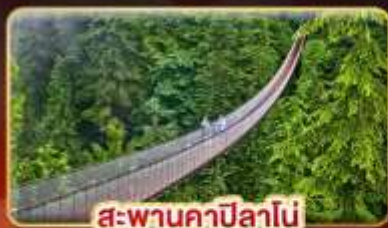
สะพานคาปิลานี