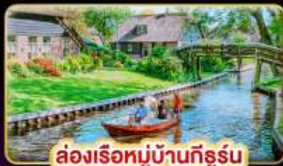
ล่องเรือหมู่บ้านกังหัน