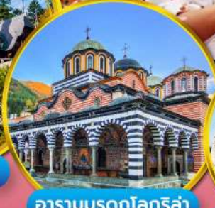
อารามมรดกโลกริลา

บุกดินแดนแห่งรัตติกาล ชมเทศกาลกุหลาบ 1 ปี มีเพียงครั้ง สัมผัสวิถีชีวิตชนพื้นเมือง เยือนเส้นทางมรดกโลก