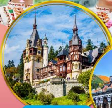
ปราสาทเปเลส