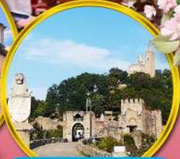
ป้อมชาเรเวทส์