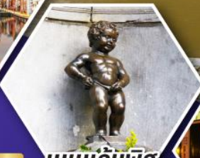
แมนเกินฟิส