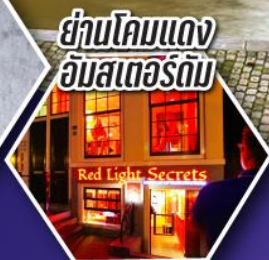
ย่านโคมแดง อัมสเตอร์ดัม

ตะลุยอัมสเตอร์ดัม ทั้งจตุรัสดามสแควร์ และย่านโคมแดง (Red Light)