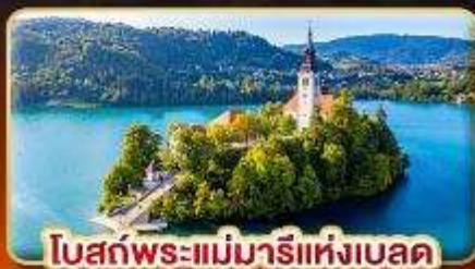
โบสถ์พระแม่มาเรียแห่งเบลด