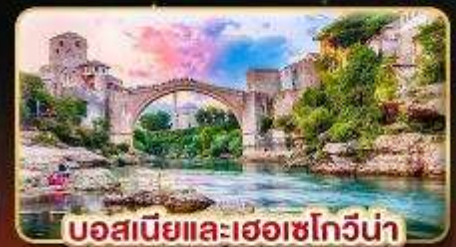
บอสเนียและเฮอร์เซโกวีนา