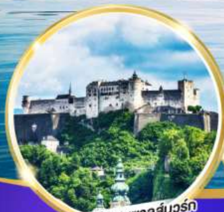
ปราสาทไฮเซนซาลส์บวร์ก