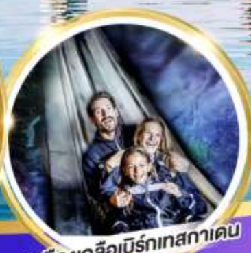
เหมืองเกลือบิรท์เทสกาเดิน