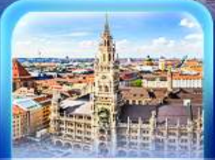
จัตุรัสมาเรียนพลาทซ์

เวียนนา ปราสาทนอยชวาสไตน์ ลูเซิร์น เซอร์แมท ชุก ซูริก