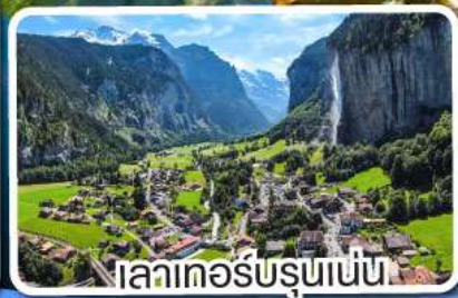
เลาเคอร์บรุนเนน