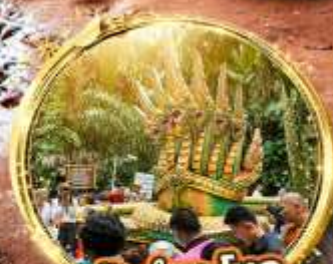
ป่าคำชะโนด