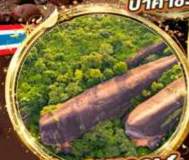
หินสามวาฬ