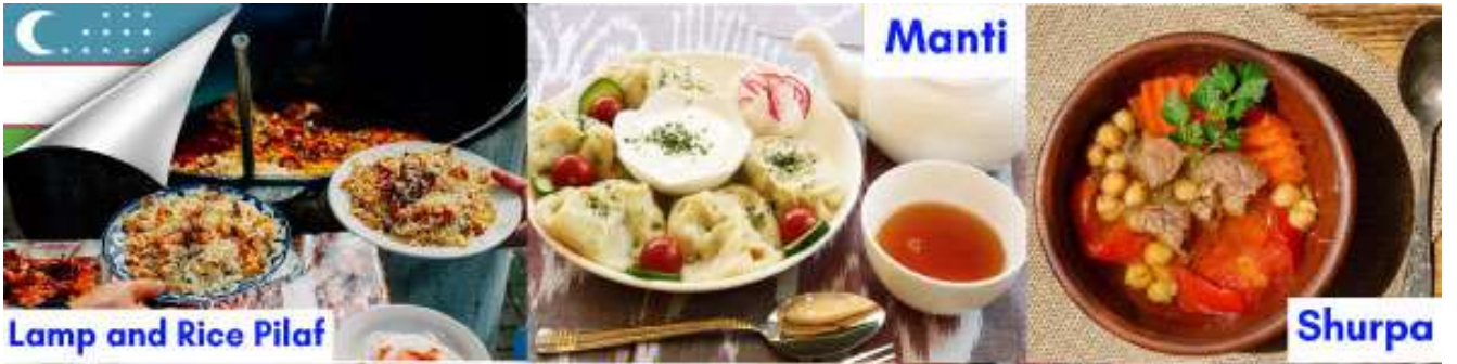
Lamp and Rice Pilaf