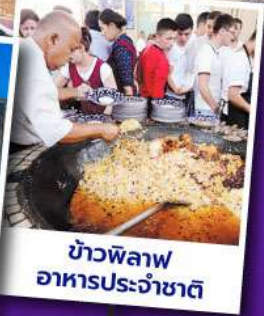
ข้าวพิลอฟ อาหารประจำชาติ