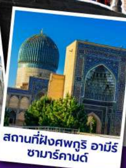
สถานที่ฝังศพกูรี อามิร ซามาร์คานด์