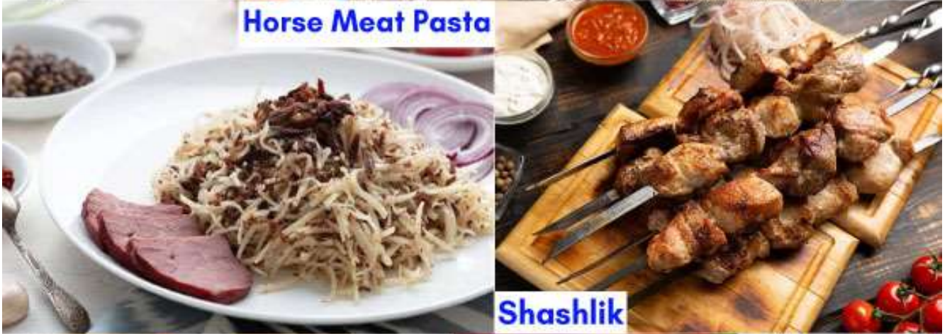
Horse Meat Pasta